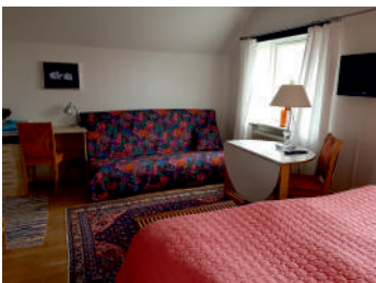
Vest værelse 2-4 personer