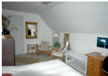
Øst værelse 2 personer